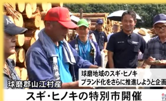
球磨地域のスギ・ヒノキ ブランド化をさらに推進しようと企画 スギ・ヒノキの特別市開催