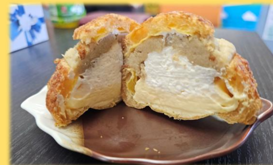
試作品（シュークリーム）