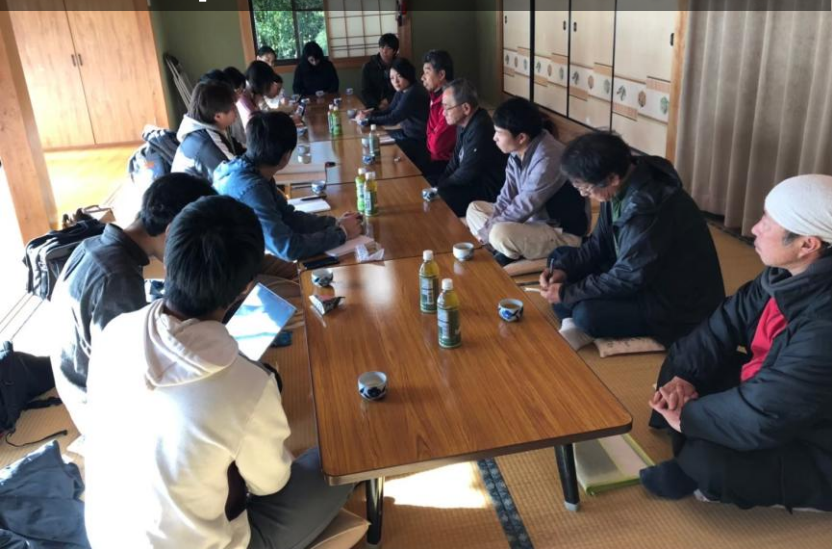
2018年 日本酒プロジェクト始動