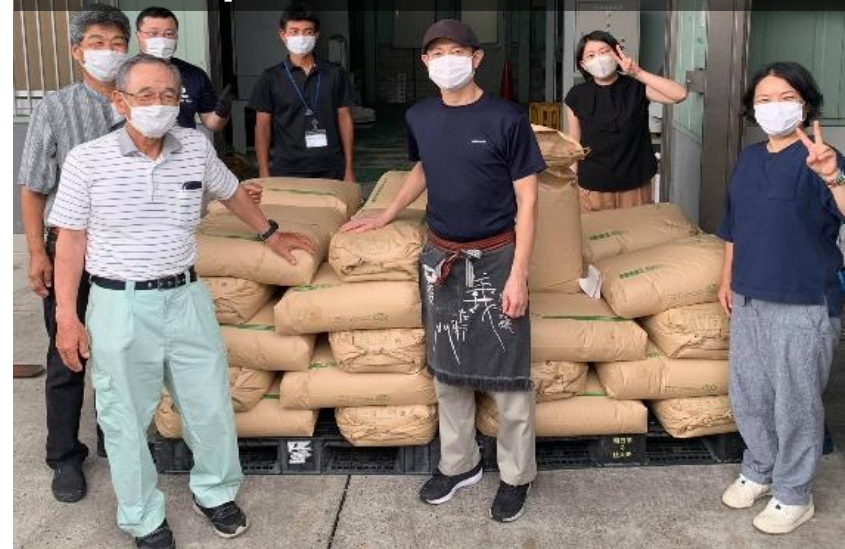
2020年 チーム道行竈を法人化