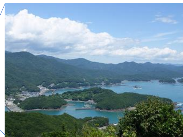
伊勢志摩国立公園内の鶴倉園地