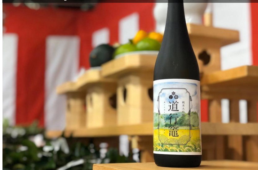
2019年 純米大吟醸「道行竈」完成