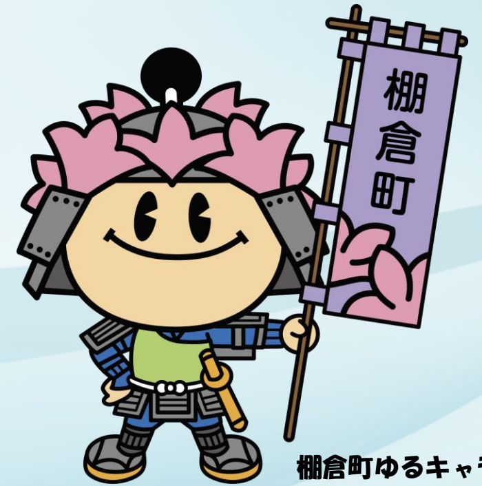
棚倉町ゆるキャラ 「たなちゃん」