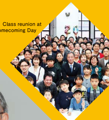
Class reunion at Homecoming Day