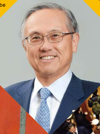
Faculty of Agriculture class gathering